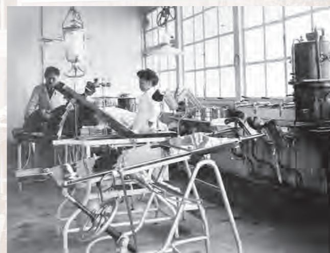
上左：診察室（大正時代）

真摯に医療を行い続けてきた先人たちの想いを受け継いで 皆様に頼っていただける病院として地域医療に貢献できますよう 日々努めてまいりたいと思います。