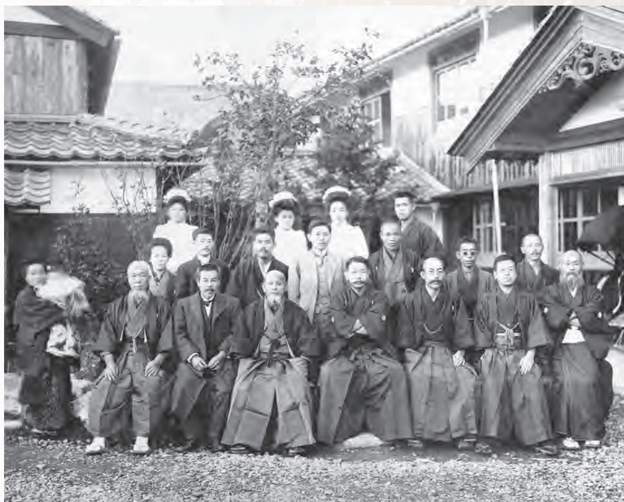
大正二年 私立林病院創立時撮影